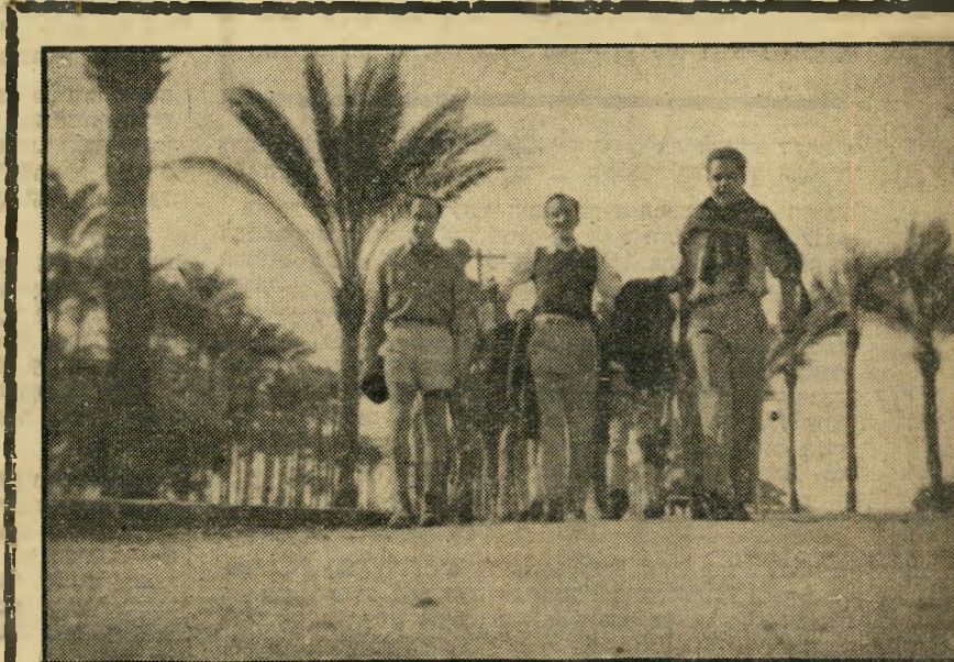
שמאה, ימין... חברי תנועת נוער ציונית במצרים. באחד מטיוליהם המאורגנים. צעירים אלה עברו אחר-כך הכשרה בחווה ליד קהיר, עלו ארצה בגלוי, בדיעת השלטונות.

אם לא רק התפיסה ההיסטורית עניינה את אותם הצעירים. הם חיו תחת השפעת החלום הגדול של שיחרור העם המצרי מהכיבוש האנגלי. לגביהם, לא היה אויב גדול מהאנגלים. אני זוכר באיוו שמחה היו קוראים על מעשי החבלה של האצ"ל בארץ-ישראל. "כמה שאתם תהרגו יותר אנגלים אצלכם," שמעתי לא פעם, מחברי לבית-הספר (האנגלי), "זה יותר טוב בשבילנו."