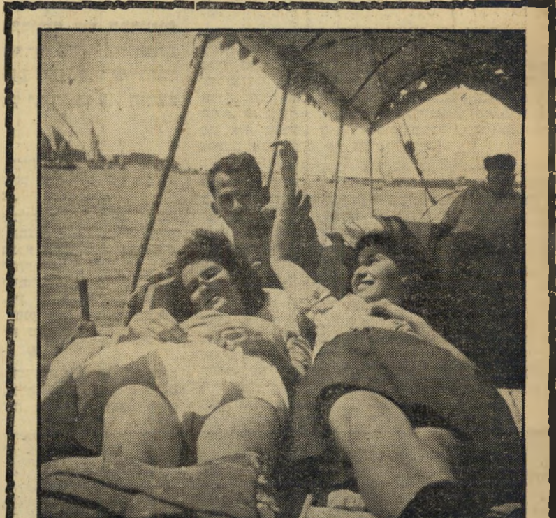
שייטת עץ הנילוס. צעירים וצעירות יהודיים, על סיפון ספינת מירפשים, בקהיר. לפני הגזירות האחרונות, היו יהודי מצרים חופשיים לחלוטין לטייל ברחבי המדינה.

עתה מונח לפני אלבום תמונות. על דפיו מודבקים צילומים מהשנים שביליתי שם, בין יהרות זו. הנה, למשל, תמונה גדולה: שורה של צעירים ברקע, מצדדים, שעה שבחורה מעלה דגל אל ראש התורן. הצעירים הם חברי תנועת השומר הצעיר; הדגל הוא דגל תנועת השומר הצעיר. המקום: חוף מנורה, בין ארמון מונטניה של סארוק לבין חופי הרחצה האקסקלוסיביים ביותר של אלכסנדריה. הזמן: אפריל, 1946.