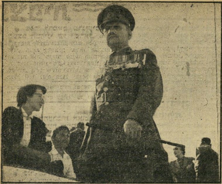
מפקד כוחות או"ם ברנמ הגנרל הקנדי חסר הכשרון...