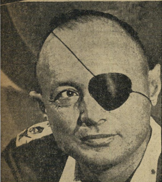
Moshe Dayan: At 41, Head of Israel's Armed Forces (See International)