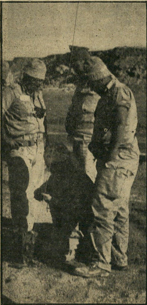
מחברים טלפון. במרכז עומד מפקד החטיבה, משגיח על קשר, המחבר טלפון לקווים המצריים, להגשת אולטימטום.