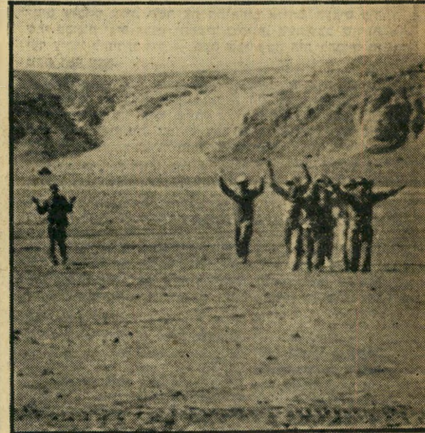
השבויים הראשונים. עוד לפני פתיחת הקרב הניקרי, הכניעו מטוסי חיל האוויר עמדת מקיב מצרי, שחולשה על הכביש לשארם אל-שייך. גיפ עלה על הגבעה ואסף את חיילי העמדה הנבוכים.

תם, מתחבקים ומתנשקים. המקלען, לידי, מנשק את המקלע שלו.