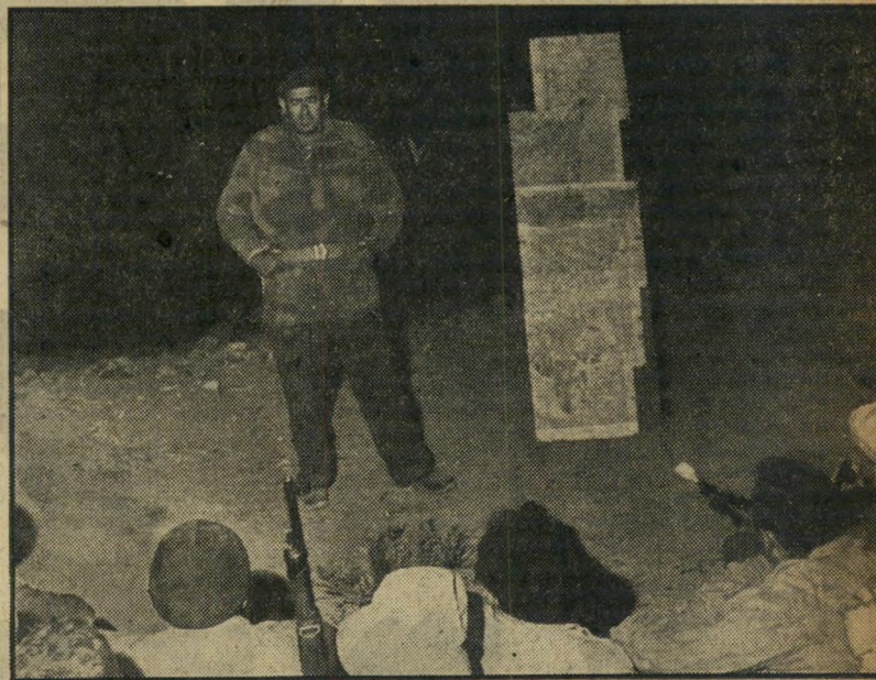
המפקד מסביר. אברהם יפה, מפקד החטיבה, מודיע לאנשיו על התחלת הקרבות בחצי האי סיני. בעזרת מפה, הוא מסביר את המשימה שהוטלה על החטיבה: פריצה דרומה וכיבוש מיצרי אילת מידי הצבא המצרי, שעה שיחידות אחרות של צה"ל פועלות בצפון.

התשובה היא שלילית. הפצצות המצריות נפלו בישימון החולי. החטיבה הזרת לשינתה.