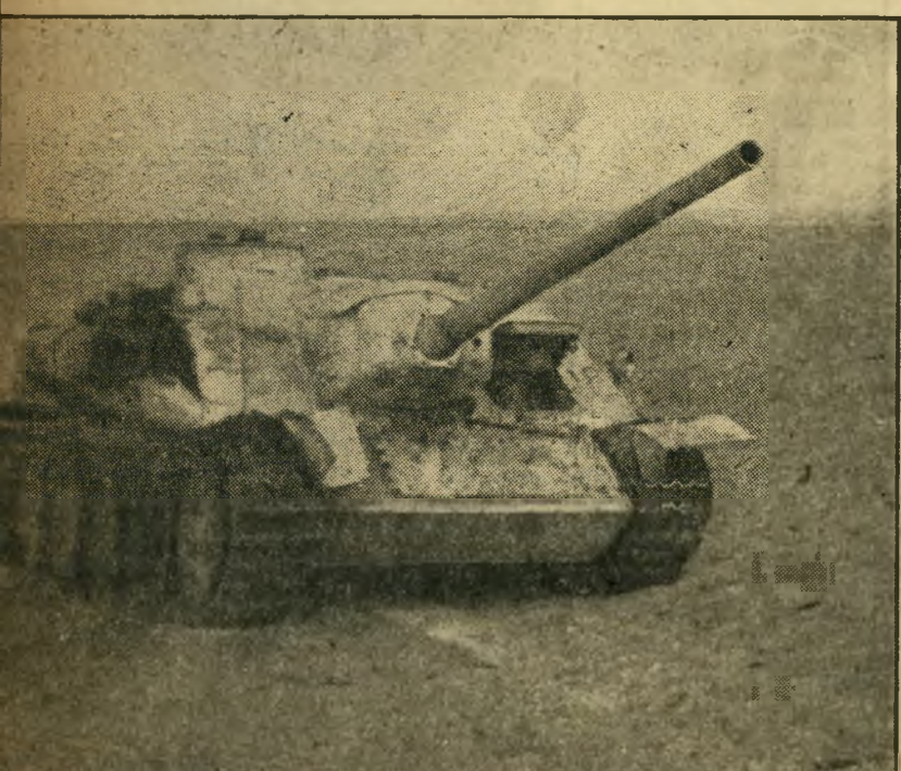
טאנק מצרי זה, מתוצרת סובייטית, בעל תותח בקוטר 85 מילימטרים, הוא אחד מרבים הטוסלים בצדי דרכים. הוא חוסל בקרב השריונים בדרך לאיסמעיליה. אתרים נלכדו והפעלו מיד.