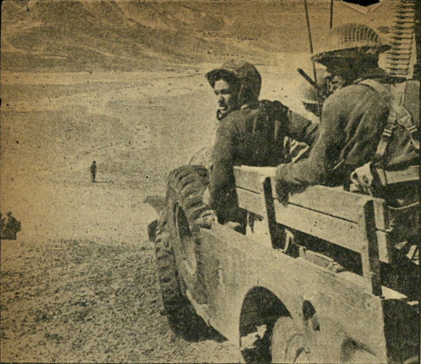
אל הכביש: הכוח המשוורין של צה"ל, שאיגף את המוצבים האדירים של הצבא המצרי אשר חסמו את הכביש מניצנה, עובר בשטח הקשה. המטרה: לעלות לכביש בעורף האויב.

בינתיים קרה במצרים משהו שהיה לו ערך חיוני, אם כי אולי לא מכריע, על המערכה. חיל-האוויר הבריטי והצרפתי כוח בהתקפת-מחץ על שדות-התעופה המצריים, השמיד למעשה את כל המטוסים הסובייטיים החודשים. אין ספק שגם בלי השמדה זו היה חיל-האוויר הישראלי מתגבר על המצרים. שלא ידעו להפיק מן המינים החודשים ביותר את מלוא כוחם הפוטנציאלי, השתמשו בהם באופן מסורבל וחסר-חוקף. אולם השמדת מטוסים אלה במולדתם קיצרה את הדרך והקלה בהרבה על תנופת-הבזק של הכוח הפורץ לעבר איסמעיליה. חרץ מזה הצילה את תל-אביב מהפצצה בטוחה עוד באותו ערב.