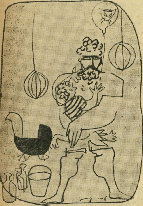
גייסו את אשתו.

אחת לכמה שנים, ב־29 בחודש, אחר כך אפשר להתפסס עשר שנים בזכרונות. ואפילו להתפנס.