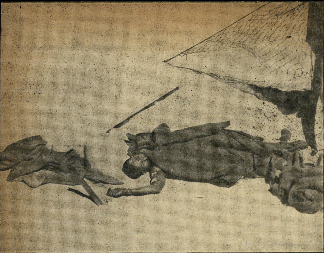
הירוק מצרי: הוא היה מוטל בצד משאית, ממנה ניסה להימלט. מישהו כיסה אותו בשמיכה. מלחמת