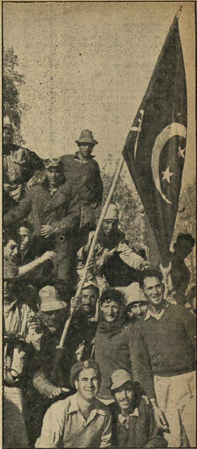
כובשי המוצב החטיבתי, שעות מעטות אחרי הכיבוש, מתחת לדגל הירוק של הצבא המצרי. רבים הדגלים הנטושים.

התברר כי המכוון, שהפעיל את משאבת הבאר, ברח לעבר הים ונטל עמו את מסך תחת המשאבה. הסיירים נטלו עמם את ראש העיר, ערבי מכובד בעל כרס ומשקפיים כבן 60, יצאו עמו לחפש את המכוון. אי אפשר היה למצואו. לראש העיר לא נותן רה ברירה אלא לגייס כמה שואבות מים. שתעלינה בפחיהן מים לחיילים.