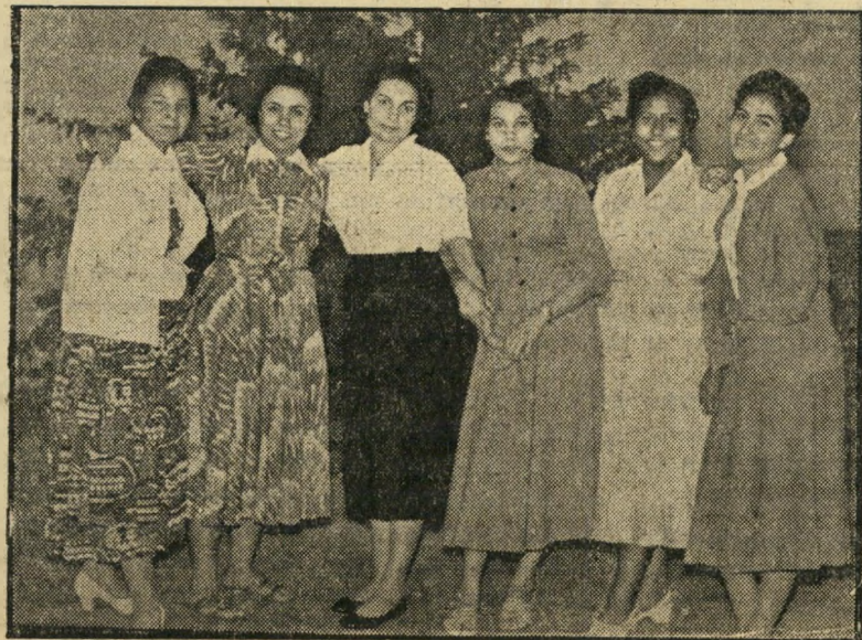
גדויה מקאהיר: אחת הגבירות המצולמות, בנות אופייניות של החברה הגבוהה בקאהיר, שלחה אותה בצירוף הבטחת אהבתה וגעגועיה לבעלה, שלא הספיק לקבל את הדואר.

גם לישון לא ניתן לחברה במהרה. היה עליהם להשלים את המלאכה, לחסל את הד מיתחם המבוצר, בו שרדו שרידי הדיביות המצרית השמינית עם מסה הדיביות. המיתחם רוכך במשך שעות ארוכות באש מרגמות 120 מילימטר ותותחי השריון. לא נשאר בו מטר מרוכז שלא ספג מתכת רותחת למרות זאת, כאשר ניסו הטנקים לעלות על המוצבים, ניתקלו באש שאילצתם לסגת. הוומן סיוע אוירי. תוך דקות הגיעו שני אורגאנים, שצוללו מעל המוצבים, כמעט נגעו בכנפיהם בקרקע. שהייתם הקצרה ב מקום הספיקה. הטנקים פרצו את הגדרות אחריהם עלו החילים, שתוך כדי הסתערות המשיכו להמטיר פגזי מרגמות קלות על המוצבים. לאחר שנכבש המוצב האחר, נכד נעו הנשארים. בין הנכנעים היה מסה הד דביות המצרית ה'8, על מפקד הדיביות עצי מו, רבאלוף יוסף עכדאללה אל-אגרוודי.