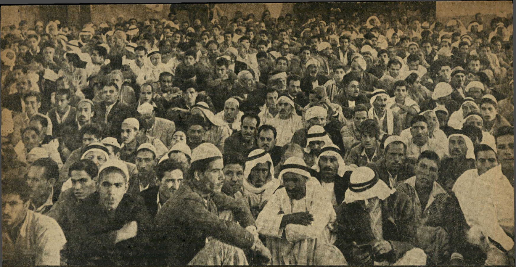
ישראל החדשים: חלק ממאתיים אלף התושבים הערביים, שנוסארו ברצועת הפכו ישראל החדשים. הם המשנים את היחס המספרי בין העמים במדינה במידה ניכרת. בתמונה נראים הגברים, תושבי עזה, שרוכזו יחדיו ביום הכיבוש, לשם זיהוי הפדאיון. פניהם מביעים את המתרחש בנפשם: חלקם מדוכאים, פני אחרים זועמות ואילו פני רבים מחייכות בשביעות רצון.

פול בהם נמסר לאנשי ההגנה המרחבית, בני ישובי הסביבה.