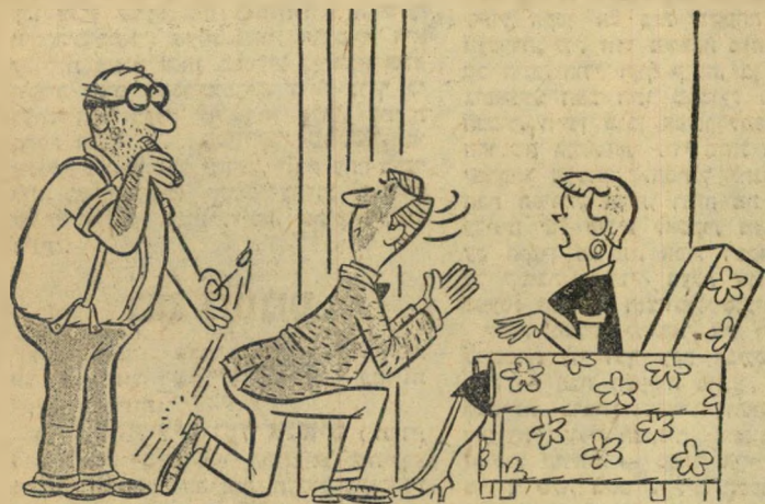
— אבל אבא. אולי אריק רוצה להגיד לי משהו פרטי?