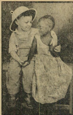
"אני לבן וחיא שחורה..." מול קרנר (4:8), טנגאל