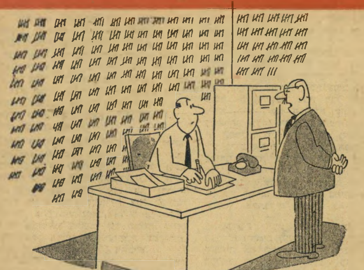
— אגב, פינקלשטיין, כמה זמן אתה כבר עובד אצלנו? —

בשתי "רוחאל". "שטעטני". "לא - סט"ג". "ת. 1583 התזחנת השבוע". חלים