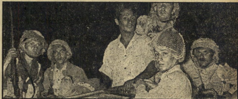
החוזרים. כך נראו הלוחמים, עם תום הפעולה. רובם היו עדיין עייפים ונתונים במתיחות הרבה שאפפה אותם מן הרגע הראשון שיצאו לשדה. שמחת הנצחון בפניהם מהולה ביגון

הכוח לנתק את המגע עם האויב ולסגת אל הגבעה. את הפצועים העבירו אדו אחד, כי לא היו מספיק לוחמים להחזיק בגבעה ולהוביל את הפצועים במרוכז.