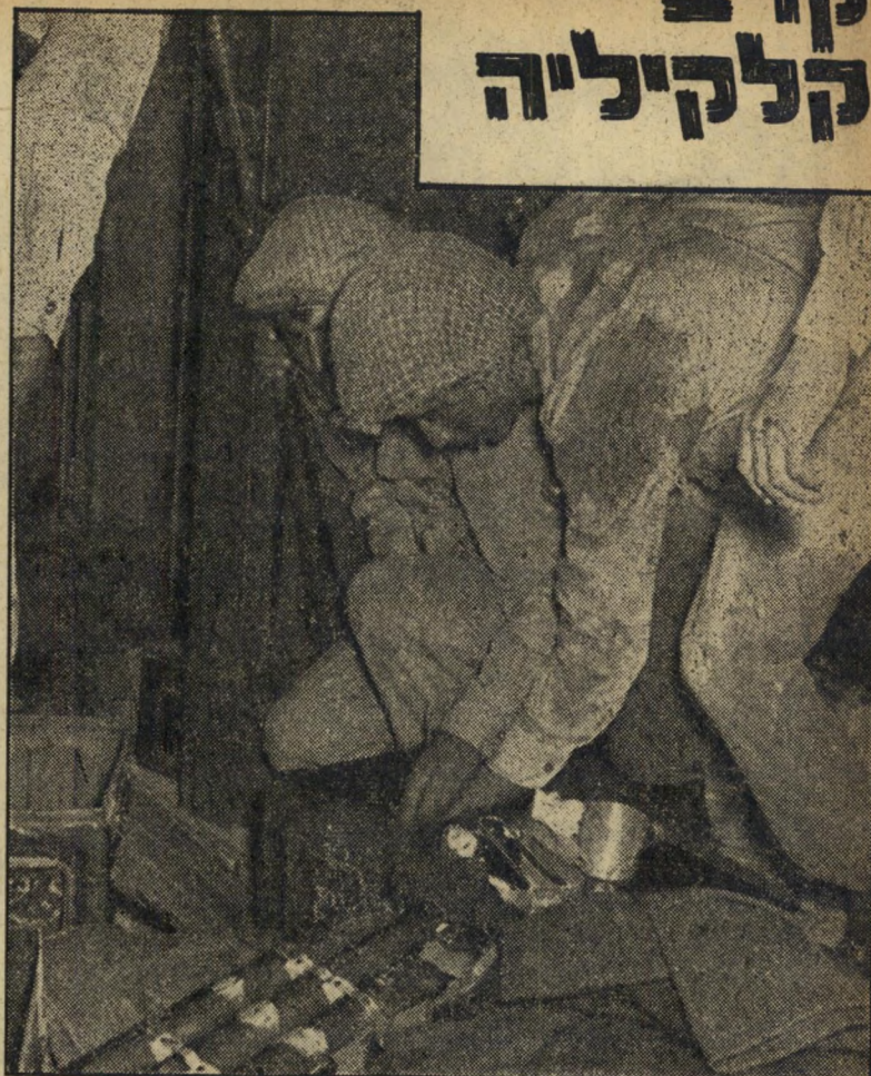
השלל. לאחר כיבוש תחנת המשטרה, פרצו הלוחמים את חדר הנשק והוציאו משם שלל רב, שלל מקעים, רובים, פגזים ותזמושוש. בתמונה: לוחמים בוחנים את השלל.