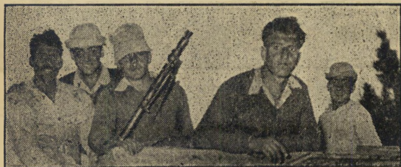
על נפילת חברים. אתם החזירו, נוסף על נשקם, גם שלל שהוציאו מתחנת המשטרה ושני דגלים של יחידות הלגיון הירדני, שנפלו לידיהם בשעת הקרב על מבצר המשטרה.