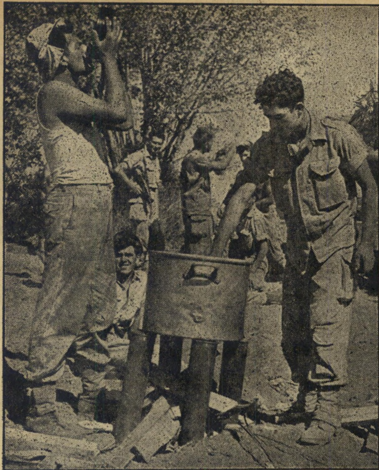
ארוחת בוקר. כמה לוחמים מרוכזים סביב סיר גדול, בו הרתיחו תה. כמשענת לסיר השתמשו בווטילי פגזים שקלעיהם פיצחו את בנין הנטוטה. ביניהם הוזקקו הסדורה.