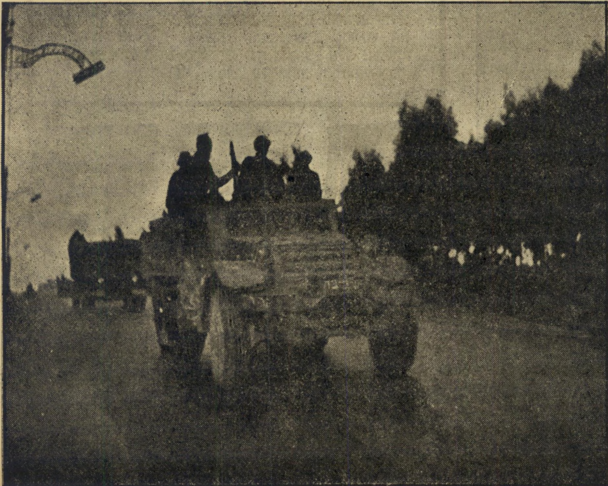
אל הקרב. עוד לפני החשיכה עברו הלוחמים בכביש הראשי של המוסבה, בדרום לנקודות היערכות, שמחן יצאו לפעולה. על הקצה הימני של מחן המשוורין רשם אחד החיילים בניר את השם „קהיר“. כתובות אחרות היו: „קדימה לסכסו“ ו־„ישר רבת עמון“.

עשר דקות בסך הכל הלמו הפגזים ב־בטון. ואז הורה מספק הכוח הרגלי לתו־תחים להפסיק את האש. אנשיו, שהתקדמו בשעת ההפגזה עד למבואות המיבצר, היו מוכנים להסתערות. אך הפקודה היתה: ל־המתין עשר דקות בין גמר ההפגזה להת־חלת ההסתערות. כדי לאפשר לאנשי המש־טרה להוציא מהבנין נשים וילדים העלו־לים להיות בו. עשר דקות שנראו אינ־ספיקות.