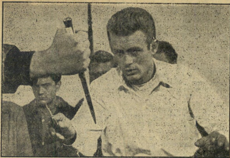
שחקן דין כהן, מרד הנעורים אבא אמר: אל תהיה אידיאליסטי!

את מרלון ברנדו רוקד ושר. בעוד שבשטח הרוקד מבצע בראנדו רקוד ממברג'אמבו אחד בהצלחה די משכנעת, אין לומר שגם שירתו מצלחת.