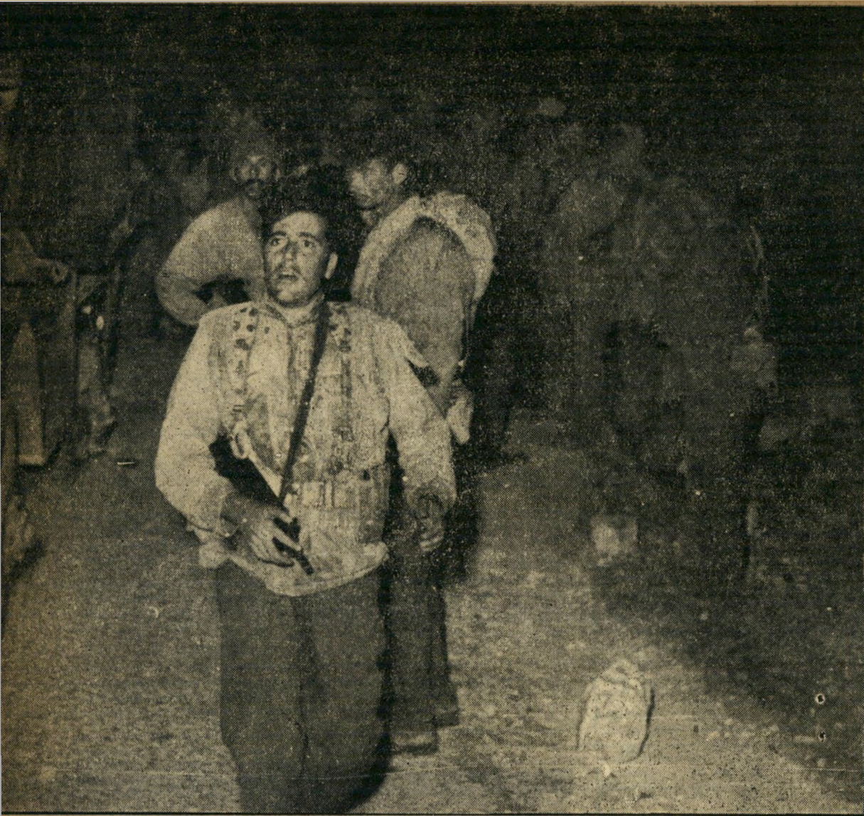
השריון הגיע. לאחר כיבוש שני המשלטים החוסמים את הכביש, עברו המשוריינים שבכוח הממונע את מחסום הגבול והצטרפו אף הם לפעולה. בתמונה נראים אנשי הסור הממונע מתחברים עם אנשי חיל הרגלים, שכבשו את המשלטים שעה קלה לפני כן.

בני הצמיד את מבטו להולך לפניו. מדי פעם היה נוצר פסק. החברה היו מצטרפים בסוף המדרון ובבת אחת קופצים קפיצה ארוכה מהצוק אל תחתית הוואדי. אחר כך היו קמים על רגליהם ורצים כמו משוגעים כדי להשיג את חבריהם ולשמור על קשר עין.