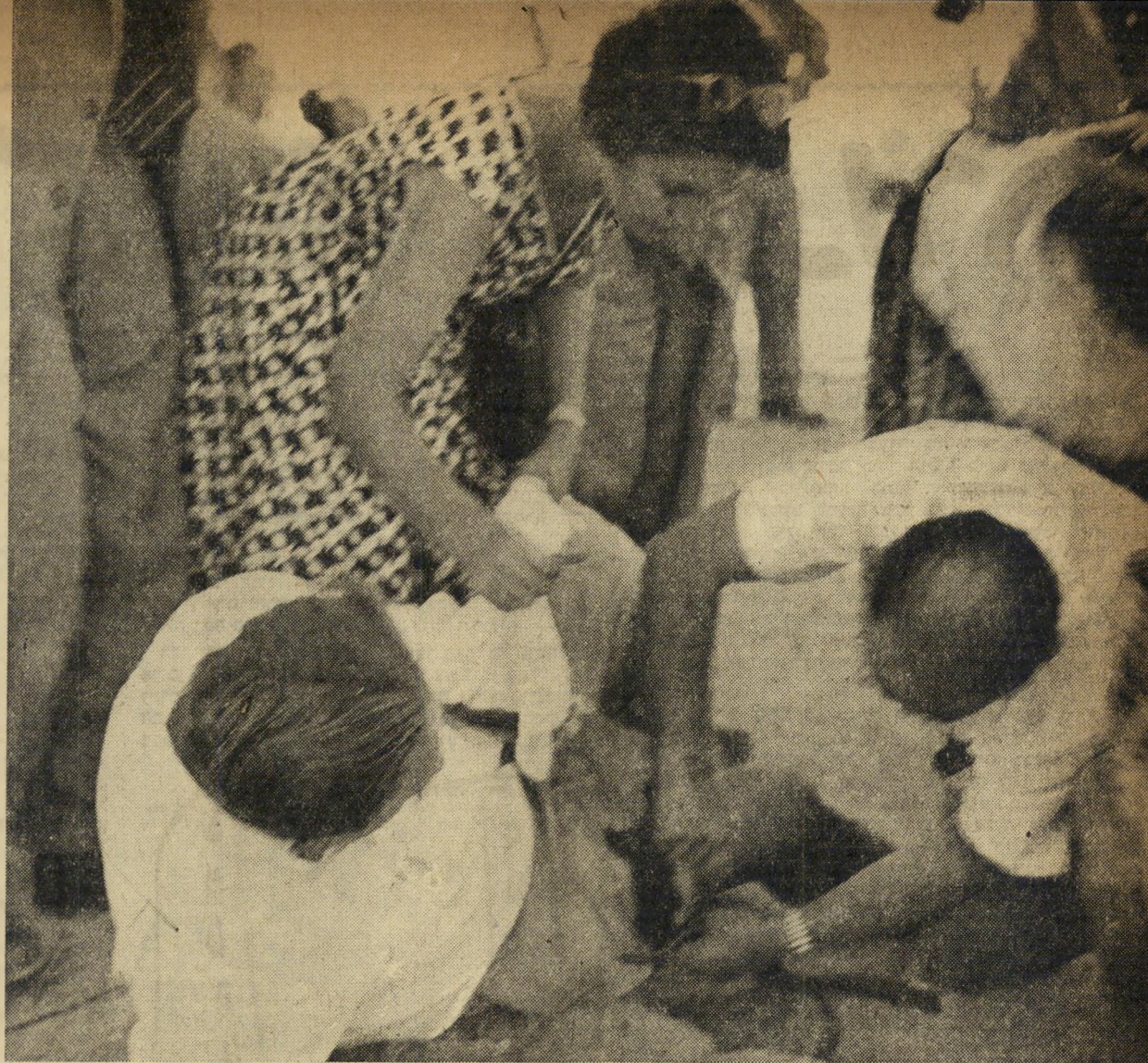
הקהל החל מתאושש. האנשים שעמדו על הגג השתטחו והחלו זחלים אל המדרגות הירידה, הנמצאות בצד המוגן מפני הי ריות. הפצועים ניסו לזחול לשטח המטה, אחרים הורדו עלידי אנשים שכבר ירדו מן הגג, חזרו כדי לעזור לפצועים.

כעבור כמה שניות השי תנה הכל. המשתטחים זחי לו מן השטח הגלוי לאוייב לעבר הצד האחורי של הי גג הקמור, שחיה מוגן. אז למ חלק לא זחל. היו אלה היה רב, שנחרבה בו כמי קום, וכמה פצועים שלא יכי לו לזה. פצועים אחרים החי זיקו באכזבהם השותתים דם, צעקו "אני פצוע!" רי ניסו להגיע בכוחות עצמם בשעה שהחרוגים הראשי נים הועברו לחדדייהמתים, המשוך המדען הצעיר מנו פרוש בהרצאתו בשטח הי מוגן של התל. בעד השני של הגבול הכינו שלטונות ירדו את הסכרם הרשמי, ביתיים החלו הראשונים מבין הקהל באזור הפגיעה להתאושש. הנועים ביותר חזרו לגג שטוף האש, החלו בהוצאת הפצועים מאזור הסכנה דרך המדרגות הנמצאות בצד האחורי. חולים לחוליהות.