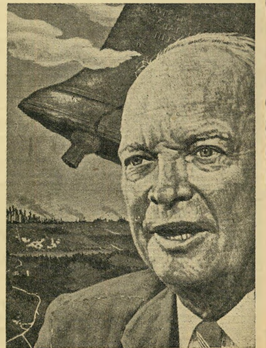
אייזנהאואר ניקסון מאחור

● אם כי אולימפיאדת מלבורן, שתחל כי חודש דצמבר השנה, תהיה מאורע הספורט של השנה, יעמדו במרכז ההתענינות הקהל הישראלי דווקא משחקי הכדורגל נגד נבחרת תורכיה, במסגרת המשיחיים על הגביע העולמי. חוסר ההתענינות באולימפיאדה יהיה בגלל חולשתה של המשלחת הישראלית, שהיא חסרת כל סיכוי להשיגם כל שהם.