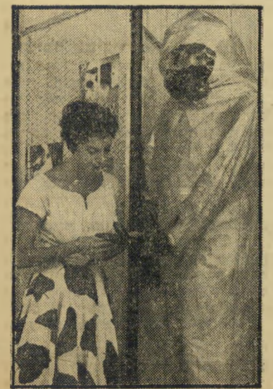
כוכבה אטומית בתערוכה למה לא לפני 1000 שנה?

* יסוד בעל תכונות חימיות רגילות אך משקל אטומי בלתי רגיל.