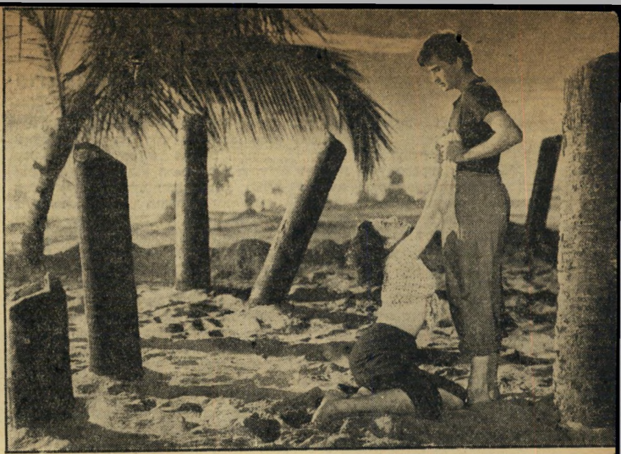
היחפן - הודו