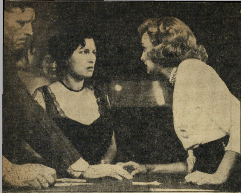
הישונה המקועקעת - ארצות-הברית