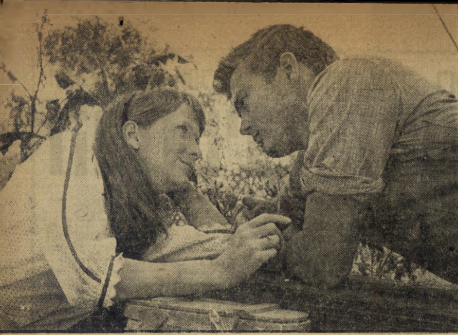
כידאת עדן - ארצות-הברית