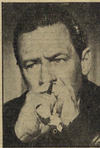
שחקן השנה ו' ליאם הולדן

ל ראשונה מזה שנים רבות, היתה שנת תשס"ז שנת שפע איכותי וכמותי לצופה הקולנוע הישראלי. בראש וראשונה גרמה לכך העובדה הפשוטה, שהצופה הישראלי נעשה השנה יותר בררן, בעל דרישות ותביעות משלו, חדל להתחסס אל היקולנוע כאל שעשועי זול ויום יומי. מחירי הכרטיסים, שהאמירו ללא כל יחס לעליות המחירים הכללית, הטלת יחב המגן על כרטיסי הכניסה, הפכו את הקולנוע למצרך יקר. שלא כבעבר, חשב השנה הצופה פעמיים ושלוש, בטרם ניצב בתור לקופת היקולנוע.