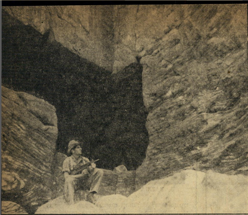
בפתח הארמון. זהו פתח אחת ממערות הענקי החצובות בסלע אדום. בפנים חצובים חדרי פאר, שיחן ושימשו לנבטים. כמערות לקבירת מתים. בהם היו נערכים טקסים מיוחדים לפולחן המתים.