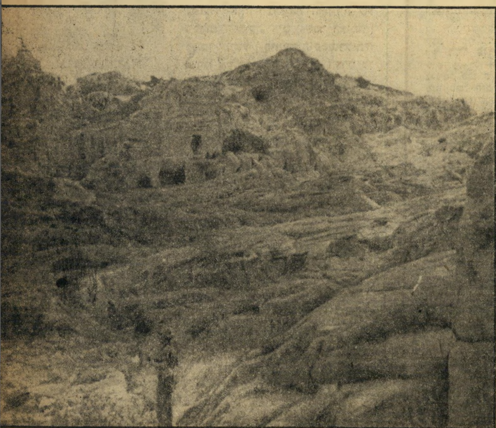
האריה. לאור היום סירו דרור לוי וחברו בין חורבות העיר האגדתית הקדומה. הריקה כיום מאדם. הפתח הגדול הנראה בתמונה הוא כניסה שמסביב לה חקקו פסלים נבטיים דמות אריה ענק. הם חצבו גם מנהרה המובילה מים ישר לראשה של הכיפה. דרור נראה בתחתית התמונה, משקיף על הסביבה.

המסירה כל צל של ספק ממאירעות שני הבחורים הישראליים בעיר המסתורין. בצהריום, ישבו השנים לסעוד את לבב בארוחה שהביאו אתם. את ק פסאות השמורים הפתוהות הוסיפו לגלי הקפסאות, שחזירים אמריקאיים שביקרו במקום לפניהם, עזבו שם. מציאות אהרות שמצאו: עקב אשה, שנחלש מעלי אחת התירות בסורה במקום, השני השתעשעו מאד, כשניסו לתאר לעצמם מה היו אומרים התיירים אם מתוך הריסות אחד הארמונות היו מופיעים לפניהם, שני בחורים ישראליים, מזוינים בעוז, רימונים וריבה, שני בחורים ישראליים הסועדים בפטרה, לעין השמש, כביתם שלהם. אולם לא היה זה לעיני השמש בלבד.