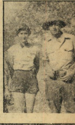
לעצמם. החורבית מימיה, חיסטו ת וכוכים חרטים מ הדדים היחידה,

עני אוסטרלי מרופט על י (תמונה למטה) הצד החדור יחד עם חבר לי ה. הוא נהרג שם עלי ירדנים. מתוך תקווה יסוים זה יספק את מי אפיב זהניע הפטרה, קרבנות ניספים, מפרי חתום הזה" בעמודים את הסיפור המלא של תני עדי דרור, בלויות נות המלעדיות, שצוליי ירדני דרור והכרו כי עצמה, עבר לגבורה.