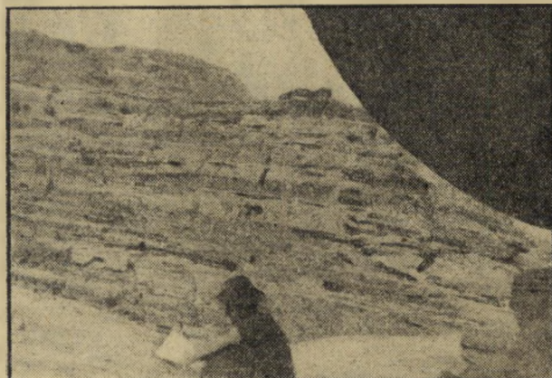
עיין במפה. דרור לוי מעיין במפה. בפתח אחת המערות בכניסה לפטרה. מסעם של השניים היה מתוכנן לכל פרטיו, נעזר במפות מדויקת שנערכו על סמך עשרות פרטים.

דרור וחברו עשו בפטרה כבתוך שלהם. הם סיירו ב בחרות גמורה. חיפשו ומצאו את המעין המפירסם, ע והוריקו מימיותיהם ומילאון אף הן. בחופשיות מוס בתילי ההריסות, גילו בקולי קולות ארמונות עתי נסתרים, חפרו בעקביהם ובקת הרובה כדי למצוא מן ודברי עתיקות אחרים. פעולות אלה היו מלחמת בציל כשדרור מצלם את חברו ולהפך. תמונות אלה הן ההו