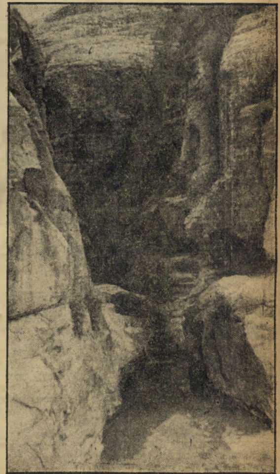
מעיין מוסה. תמונת נוף, על אדמת עבר-הירדן. אלה הם מימיו של מעין מוסה ליד פטרה. מעיין זה הוא תחילת ואדי מוסה, המוליך אל הערבה.