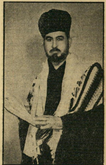
מוהל ילון הברית האחרונה

התקפות על שירות. מדי קיץ, עם תום הקיץ, בערך בחודש מאי, היו יר צאות אניות צי הדגן הרומאי מנמל אלכסנדריה, חוצות את הים התיכון לאיטליה. אולם ממחצית יולי עד סוף אוגוסט, לא יר לו אניות המיפרש לעשות את דרכן ישר מאלכסנדריה, בגלל הרוחות העזות שפקדו את מזרח הים התיכון בתקופה זו.