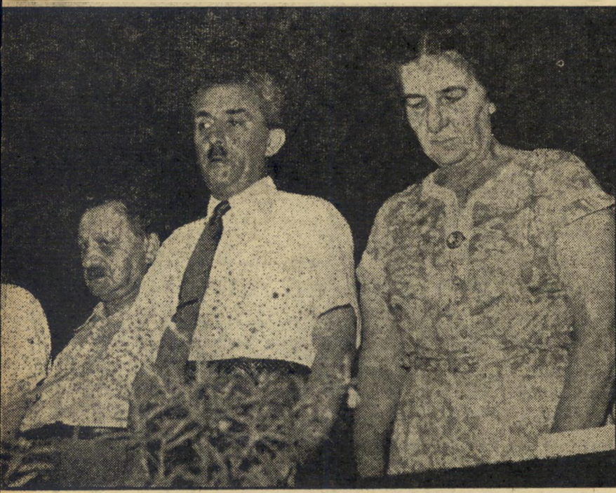
גולדה, שרת ושפרינצק על הבמה. לא עמדנו בקרב האחרון...

הנביא בעמו, הראה את הקו העיקרי של אופיו - הקו של טכסיסן מפלגתי. בהעמי- דו פנים כאילו הוא קורא קטעים מנאום כרושצ'וב נגד סטאלין, הביא כמה ציטטות ארוכות. רק בסופן גילה שהן לקוחות מ- ממאמרו של "פובליציסט ישראלי בשם ס. ש. יריב, לפני יותר משלוש שנים". ס. ש. יריב (סבא של יריב) הוא בן-גוריון עצמו. הקהל המופתע פרץ בפעם היחידה, בצחוק שוכב.