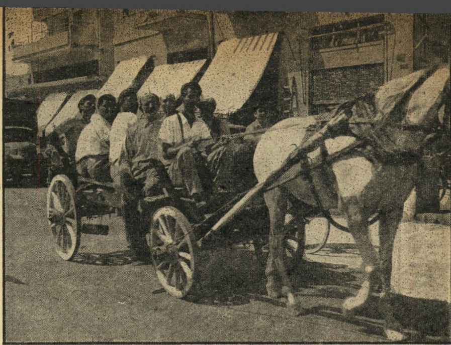
ההיפמוריה חוזרת בדמות עגלה רתומה לסוס, המשמשת כתחליף לאוטובוס. עקב שביתת האוטובוסים, חזרו לכבישים כלי רכב שונים ומשונים, שכמעט ולא נראו קודם לכן. משאיות וסנדריס, מכוניות מסחריות ומכוניות פאר — כולם עסקו בהעברת נוסעים.