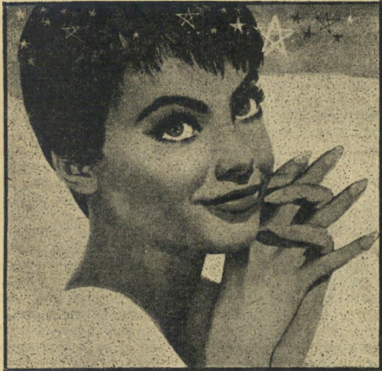
כוכבת לסלי קארון ב"סנרל הפלאים" בפעם הרביעית. לא הכי טוב

קודמותיה, הם שורת רקודים מרהיבים, בהם נוטל חלק מייקל וילדינג הבריטי.