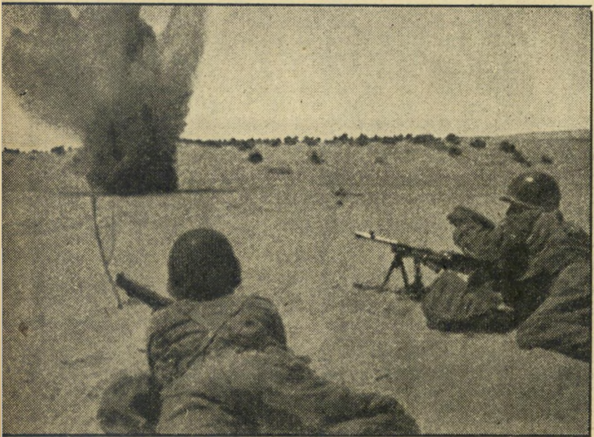
פלסטיניים באימונים. שניים מאנשי החטיבה הפלסטינית, בשעת תרגול התקפה של פלוגה. מונה החטיבה נמצא בקצה הדרומי של הרצועה, על סף מדבר סיני. ציודה בעיקרו מעודפי הצבא המצרי — מקלעים ורובים אנגליים, תותח-מקלעים שוודיים. עדיין אין לחטיבה זו נשק כבד. לעומת נשקם הבריטי, לובשים שני החיילים מדים אמריקאיים.

המקרה שושטש, שום ידיעה לא הסתננה לציבור. אולם הוא היה סנסציוני למדי: בשעת בחינת-בגרות, מתה השנה אחת התלמידי התיכוניים בארץ, מתה השנה אחת התלמידי דות מרוב התרגשות, כנראה כתוצאה מ' מחלת-לב. החודש פורסם הדו-חיון, בטי' און ציבור המורים, רשימה של מפקחי בחינות, שיכלה להסביר את סיבת ההתרג' שות הקטלנית.