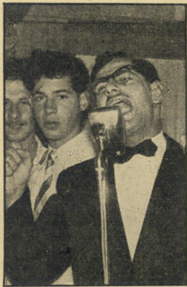
זמר צדוק בפעולה דני קיי הפתיע

פרסומו הגדול החל לפני כחודש ימים, בעת שהשתתף בקול ישראל בתכנית שלושה בסירה אחת. הוא עמד בפעם הראשונה לפני