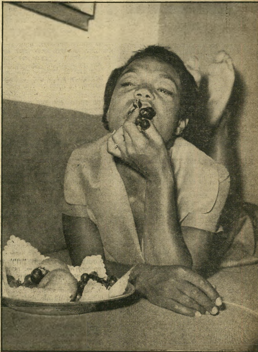
ענבי הזקב. על ספה במלון דן מוצצת ארתה ענבים ישראליים. היא נתונה לשינויים תמידיים של מצבי רוח מנוגדים המתחלפים בקצב מהיר. ללא כל סיבה נראית לעין.

קשה היה להאמין שאשה רגשנית זו תופיע בעוד יומיים כפנתר המין בפני אלפי צופים נלהבים ותסעירים ממש.