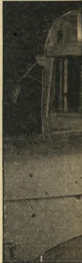
וע בנהג. העובדה שכל הפגיעות יעותיהם, על אף הנסיעה המהירה.