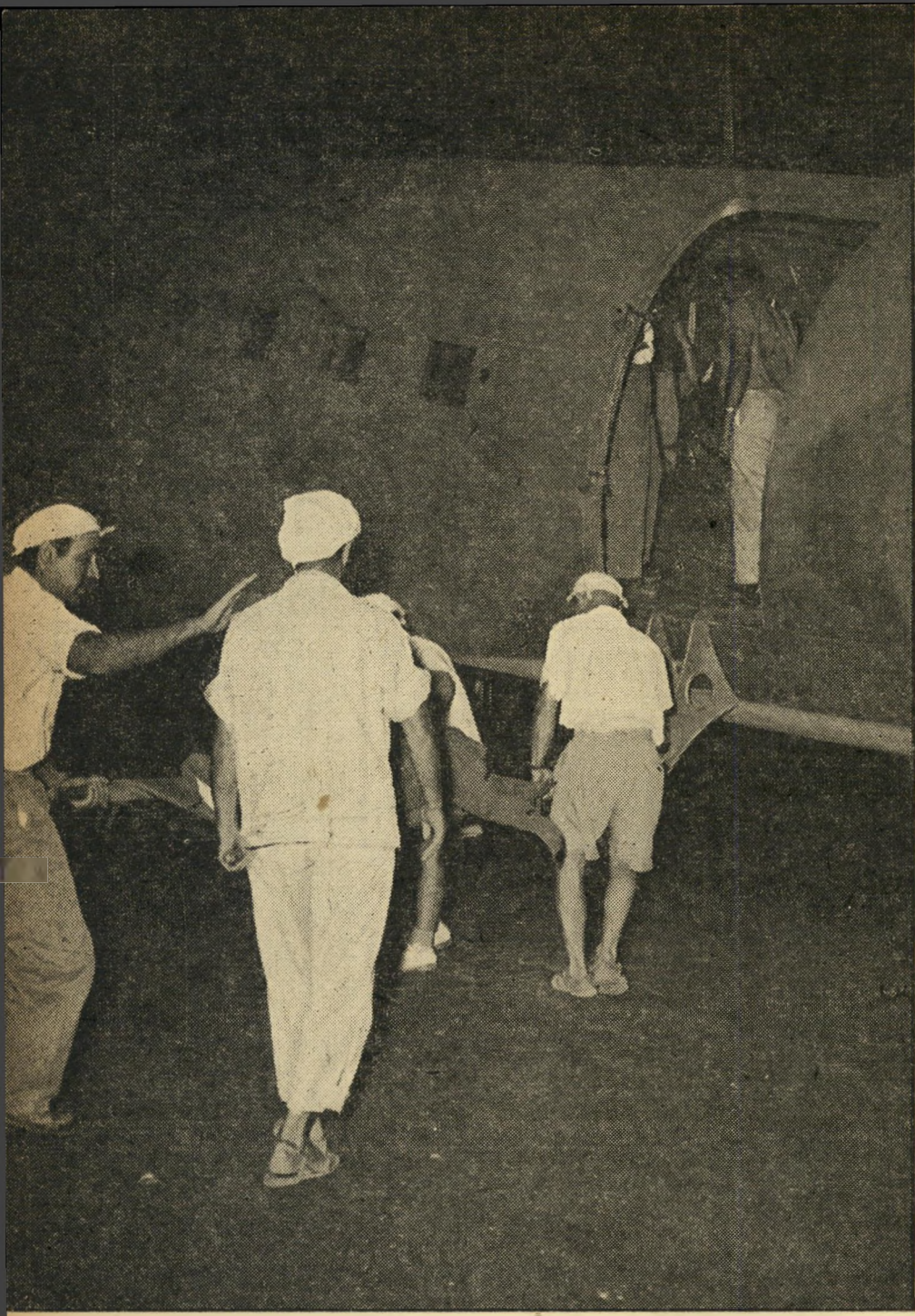
הדרך האחרונה. ארבעה תושבי אילת נושאים גופה על אלונקה. גופות ארבעת הנרצחים הועלו למסוס מיוחד, שהגיע זמן קצר לאחר המקרה, כדי להעביר אותן צפונה, לקבורה. נושאי האלונקה חובשים ממחטות.

עוד כמה נוסעים נפצעו. הושטנו להם עזרה ראשונה, קרענו חולצות, השתמשנו במעט התחבושות האישיות שנמצאו במכוונה. המשכנו לאילת, הגענו בנסיעה מהירה ביותר למרפאת קופת חולים. ד"ר קונפינו, הרופא היחידי במקום, קבע: "היא מתה". התרחקתי מן המקום, כשבחור צעיר עיכב אותי ושאל אם באתי באוטובוס. כשעניתי בחיוב, התחיל לחקור אותי לתיאורה של הבחורה שנפגעה. התחלתי לתאר לו אותה. לפתע הוציא מכיסו תמונה ושאל: "זוהי?" הבנתי שזה בעלה. לא ידעתי מה לומר לו. "הגחיות נמצאות במרפאה," עניתי ו- מיהרתי להסתלק מן המקום.