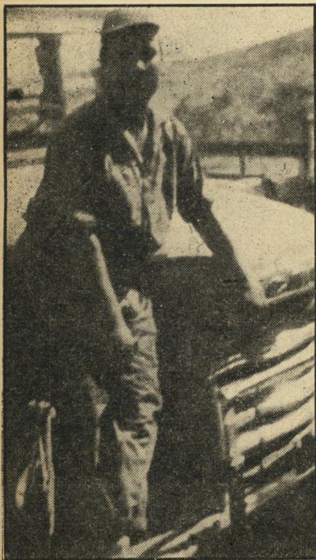
אחד שניצל. אחד מנוסעי האוטובוס עומד על כנף המכונית בהגיעה לאילת, מתאר לתושבי המקום שהתאספו, את פרטי ההתקפה בק"מ ה-102.