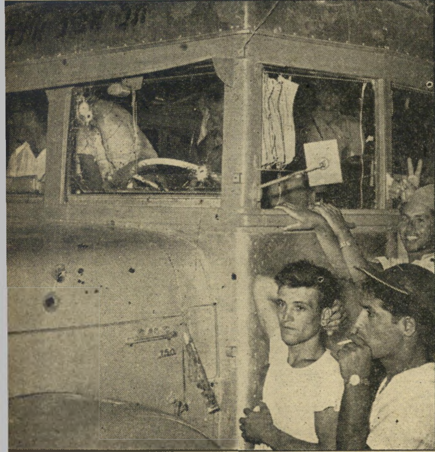
קריעות מרובות. בצילום זה, נראות הפגיעות בבירור. האורבים כיוונו את אשם היטב, ניסו מרוכזות בשמשה הימנית לפני מושב הנהג, בעוד שהשמשה השמאלית נשארה שלמה. מראה על דיוק

אדם אחד של מס בפניו הנעימו את הה אחרי בחוקה ירד חז דויד