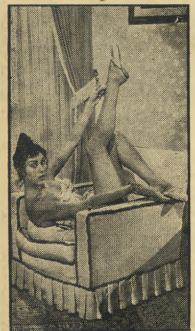
שחקנית פאוליצי ב"שבוע בנות" 1 חלקי 7

● היום הנצחי (ג'רנינה, תל-אביב). סיפור חייו של אדמירל ג'ון הוסקינס, גיבור הצי האמריקאי, שאינו מסביר מדוע לא