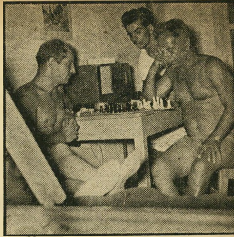
ערב. שניים מעובדי מפעל האשלג במשחק שאח בחדר. הבילוי המקובלת ביותר בלילות הארוכים החמים.

ד וגמא לסוג העובדים הדרושים בסדום, שבלעזיו יתפרק המפעל מההנהלה קבוצת בחורים צעירים, העובדים ב"פונטונים" דוברות השאיבה. רובם היו צנחנים. בי יום שיחרורם הופיע ציגי החברה בבסיס