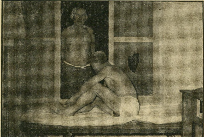
בריאות. רחוקים ממשפחתיהם ונשותיהם, מרגישים הפועלים — ביחוד הקשישים שבהם — את עצמם בודדים. הם מבליט את זמנם בקריאה ובשיחות הודיות. רק אחת לשבועיים הם מקבלים חופשה, נוסעים לשלושה ימים לביתם הרחוק, אל חיק משפחתיהם.

הם לא יחסו, באם יתפוצץ אחד הצינורות או יקרה קלקול אחר, להיכנס ערומים