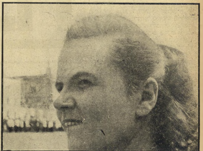
נערה רוסייה זו טיפוסית לנערות הרוסיות הנראות ברחובות מוסקבה. תסרוקתה היא התסרוקת האחדיה כמעט של כל הנשים. צבע שערותיה הבהיר, אפה המורס ועיניה הקטנות. הם פרטים שיתאימו כמעט לכל נערה במוסקבה.