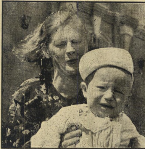
אם יילד. פועלת רוסייה מביאה בשעת הבוקר את בנה למועדון, שם יבלה את כל יומו עד שהאם תחזור מהעבודה ותקחהו חזרה לביתה. מחזה שיגרתי בעיר.

בצהרים היו בדרך כלל מונחים נחתי נק גיק כמנה ראשונה. אבל אלה שהיו באים ראשונים היו גומרים אותם. הבשר שהוגש לנו היה רק בשר קצוץ או סחון.