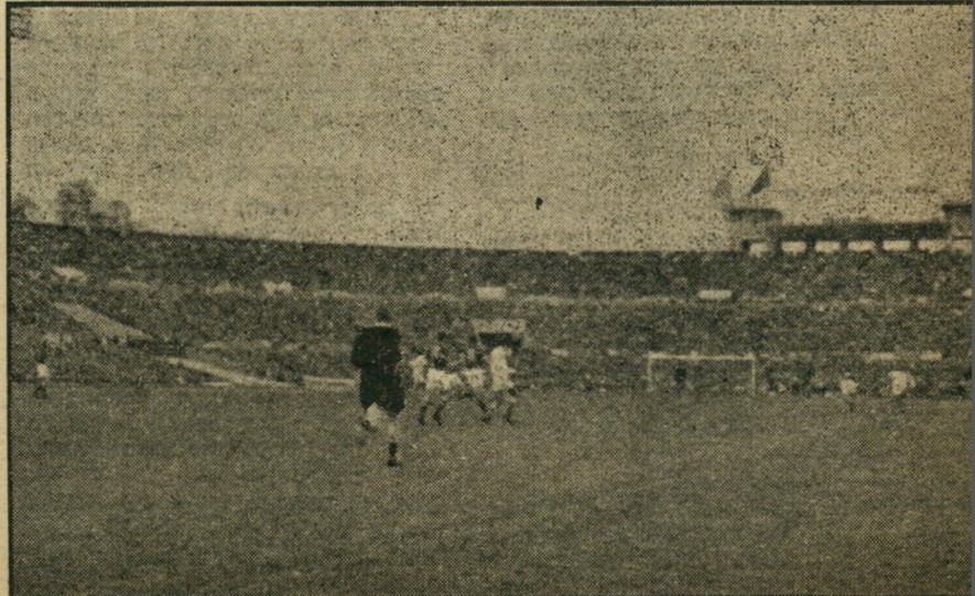
בצל הדגלים. דגלי ישראל וברית המועצות מתנופפים מעל האיצטדיון (ימין) כשבמגרש עצמו מתנהל הקרב מאתגר וראה בצ'רמלבושם ושייבם השועם הכרומי ובושם