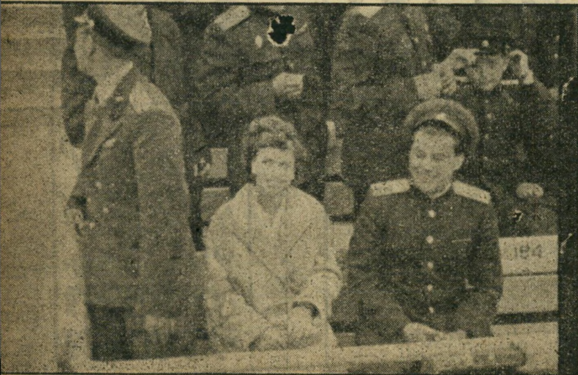
ברנשים וחתיכות. קצינים גבוהים של הצבא האדום באו בחברת יפהפיות לרושנים במיזבז האופנה המערבית. כזו הנראית מחייכת בתמונה. הם הליברל בעוכרם