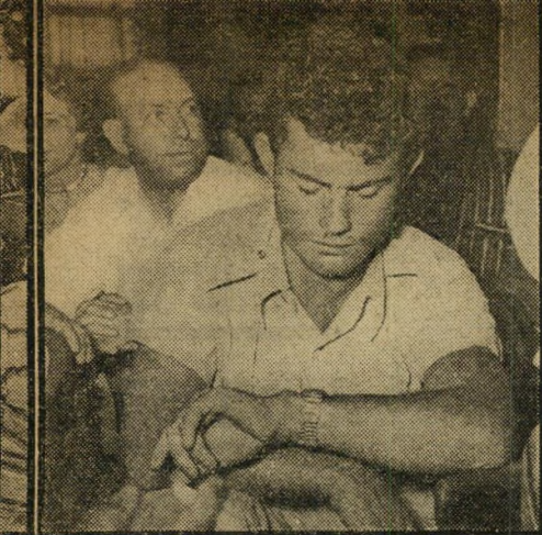
ש... עוד דקה --- הש