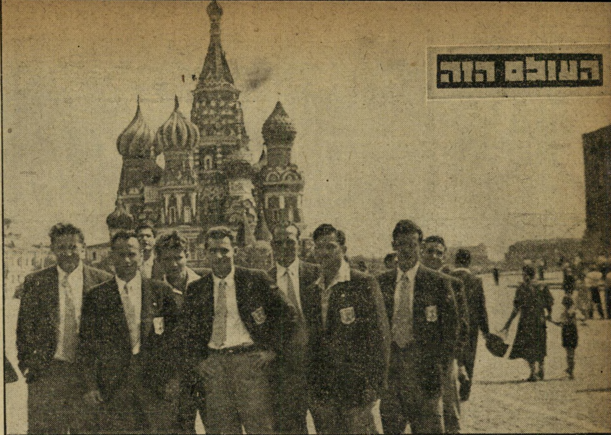
בכיר האדומה: שחקני הנבחרת מצטלמים על רקע הכנסייה הצארית של הקרמלין. עד לפני המשחק הסתובבו השחקנים רק ברחובות העיר ובקבלות הפנים הרשמיות. לאחר המשחק ניתנה להם ההזדמנות לבקר בקרמלין ובמוזיאון על שם יוסף סטאלין.

ניים במאבק זה. אנשים שמעולם לא התעניינו בספורט, נשים וזקנים שלא ידעו אף כדורגל מהו, חרדו לתוצאות המשחק.