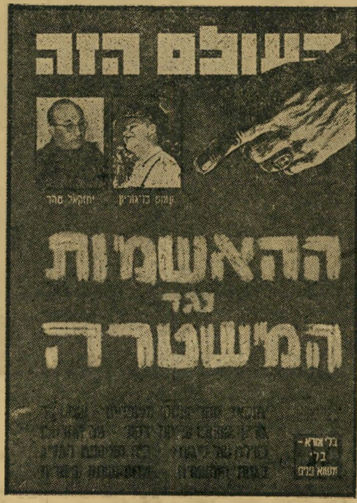
שער „העולם הזה“ 953

לפי האשמות שיטתיות, היתה שיטתו של ברדיין דומה לשיטת לייבוזיץ. בעלי המחשבות והמאורות נאלצו לשלם תשלום עגול וקבוע לכאוח המדור הפלילי. תמורת תשלום זה נהגו מהגנה יעילה: הגרומאנים יכלו ליהנות בשקט מתענוגותיהם השמימיים, בידעם כי לא תיערך סריקה מבלי שהסורקים יואילו להחזיע להם על כך מראש. בעלי העסק גם היו מוגנים מפני מתחרים בלתי-מאורגנים, שהיו נאסרים מיד — או מצטרפים לציבור פועלי-החאשיש המאורגן. כך שלט הסדר באזור זה והמשטרה היתה מסוגלת למסח באופן יעיל על טושעיה. משום מה שכח שיטתית להוכיח את האיש השלישי בשם לישית הסמלים. זהו סמל-ראשון רזה ומקריה, המעדיף שלא להעמיד את עצמו בזרקור הפרסום. סמל זה אחראי לשטח השלישי: יש לו פיקוח בלעדי על מועדוני-הקלפים. הוא ראה אורחים שלחים משחקים בהתאם לחוק את מישחק הברידג' התרבותי. משום מה לא ראה את אותם האזרחים משחקים סוקר ומשחקי-מזל תמורת אלפי לירות לילה. הוא גם לא ראה שכסף זה שולם לעתים בצורת תכשיטים שנגנבו שעה קלה לפני כן. ציבור הקלפים מאורגן היטב, ממושמע ומסודר יותר מרוב שאר חלקי הציבור. הוא שילם בשקט, התכוון בשקט לסריקות שעליהן נמסרה לו הודעה מוקדמת, וברוב ידידות גם הומיין לא פעם קציני-משטרה גבוהים ונמוכים לקחת חלק במישחקי התרבותיים.