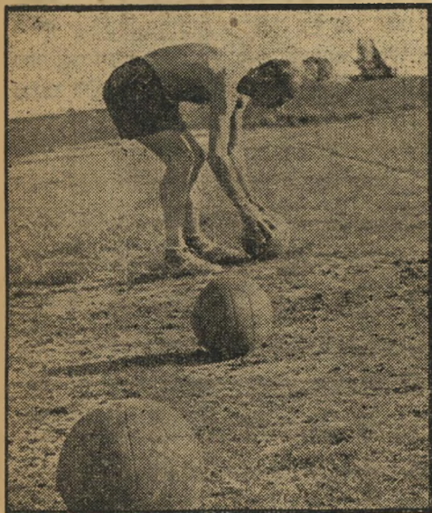
מאמן גיבונס כמה כדורים במוסקבה?

החברה. כך קורה שנחום פלד (סטלמן) מתעורר ורואה פתאום את שלמה מינצברג-מיצור (אחד המלחים) ישן יותר מדי טוב, ונותן צעקה בחלל המטוס: מינצברג, סלפון! מינצברג מתעורר בחללה: „כן, אני בא...”