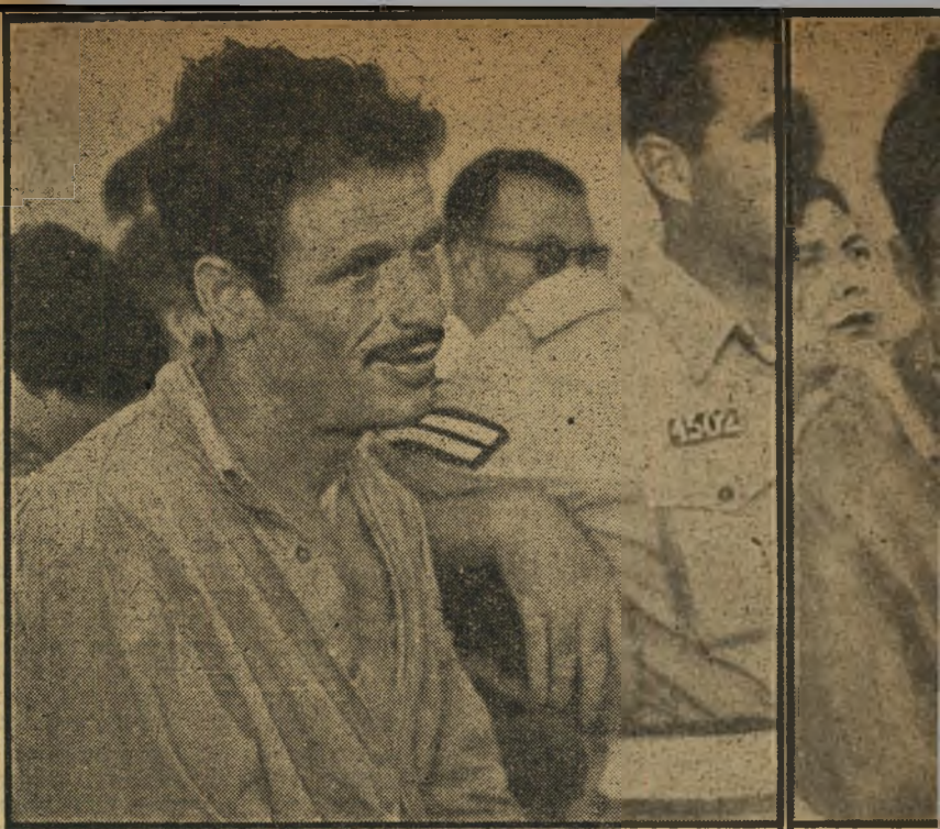
זבאבא עליידי המשטרה, תורגמו למענו עליידי שני מתורגמנים והוא חגיב עליהם בדבאון, זק מדי פעם היה סניד בראשו ואוסר: „לא, לא“ העונש המקסימלי הצפוי: עשר שנים.