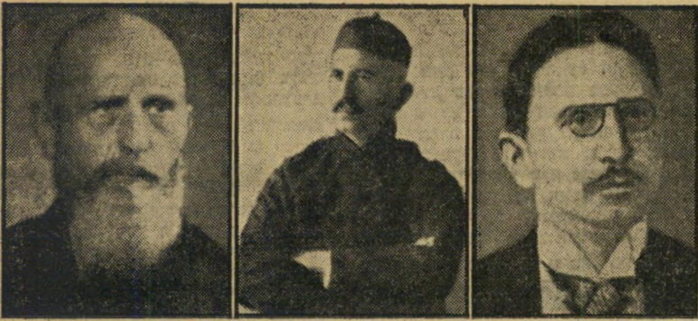
מריביטש ליינקולן בשלבים שונים • גם היטלר, גם צ'רצ'יל היו שם