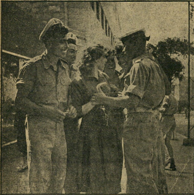
סוף-סוף, מושלנו. כמה ממלחי המשחתות החדשות מתקהלים סביב נערה חיפאית ליד שער הנמל, הראשונה שנקלעה בדרכם לאחר שובם מאימונים של שלושה חודשים באנגליה. על חוויותיהם עם הנערות הבריטיות אין בחזורים מפסיקים לספר, אך סוף-סוף היא משלנו. שלנו שוות הרבה יותר, אמר מלחיתותן אחד, בחבקו את חברתו שבאה להקביל פניה.

נקלעה אל קצף הגלים שהשאירו אחריהן הטרפדות, כמעט וטבעה בסערה. מנהל הי סקס נתן את האות, כל האורחים כמו על רגליהם, הקצינים הצדיעו בצפייה למסחי הכבוד של המשחתות.