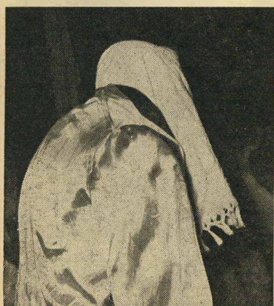
חישך למנצח. עטוף מגבת וגלימה מבריקה, יורד תאקי חפוי ראש מהזירה. מאות הצופים לא האמינו כי נקע את ידו, מיהרו לבדוק אותה במו עיניהם. תאקי התנצל: "זה לא בכוח".