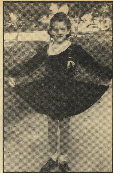
תמונת הילדות. זיוה בת ה-11 כשטרם בשערה הזהוב. אז קראו לה שירלי טמפל.