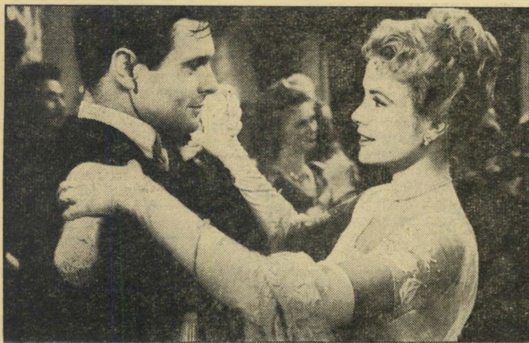
שחקנים קלי וג'ורדאן ב"הברבור" כולם יודעים

המחנך, שהוא בסרט מה שהיה הכוכב דאן פייר אימון לגרייס בחיים, מלהיט