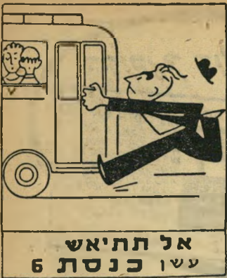
אל תתיאש עשו כנסת 6