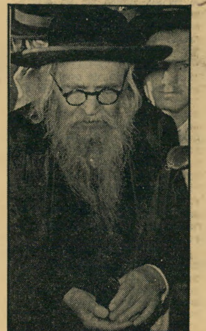
הצד השלישי, הרב צבי פראנק, שחתם על התביעה נגד אויבי הרב נסים, אך הצטרף בטענה שהוכרח על ידי הראש"ל.

• בין השאר: שורת הבנינים ליד קול"נ נוע אדיסון, בנין מסעדת רמון, הבנין מול בית-חולים ביקור-חולים, בנין בחביה, ועוד.