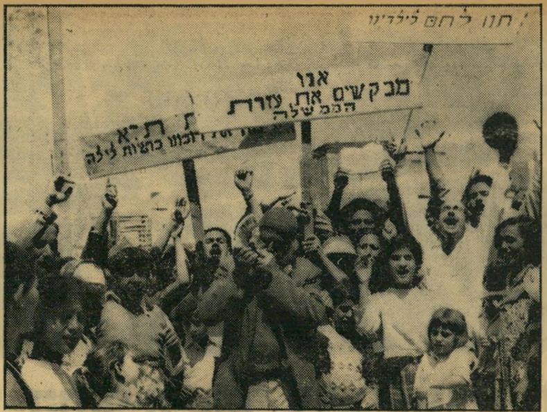
תוקע שופר בהפגנת רוכלי שוק הכרמל פקחים, לא פרחחים

רהיטי פלדה ועץ קלים מתקלפים חידוש מיוחד: דברי קליעור קומפלט פינת הוד שוחן וארבע כורסות שזורח עם כרים גוסיאזיר או פלמטי בצבעים לפי בחירת הקונה