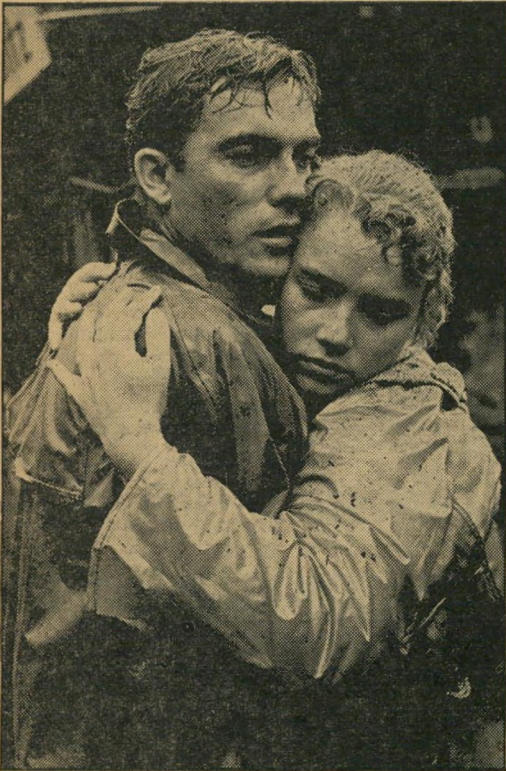
"שמיים ללא כוכבים", הגרמנים כן רצו

אין כל ספק בדבר שהגרמנים ידעו יפה יפה שהסרט עובר על תקנות הפסטיבל הבינלאומי. ואם התעקשו להביא רק