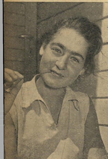
הרפה היפה, רועה