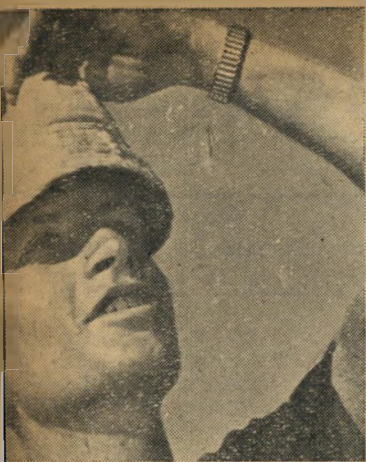
פרויקה הציניקן, מרכז